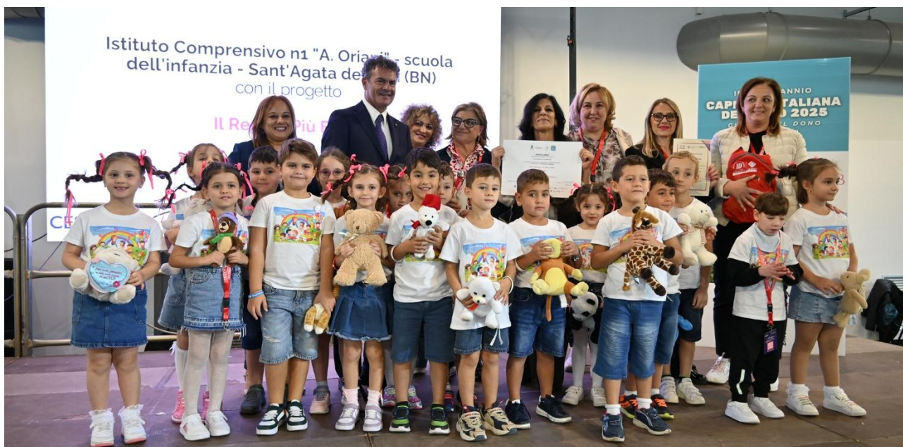
Scuola dell'infanzia dell'Istituto Comprensivo n.1 "A. Oriani" di Sant'Agata de' Goti (BN) che ha realizzato l'elaborato video "Il Regalo Più Bello"

Nel cuore della Campania, la grande festa del dono per celebrare i dieci anni della Legge che ha istituito in Italia, primo e unico Paese al mondo, il Giorno del Dono