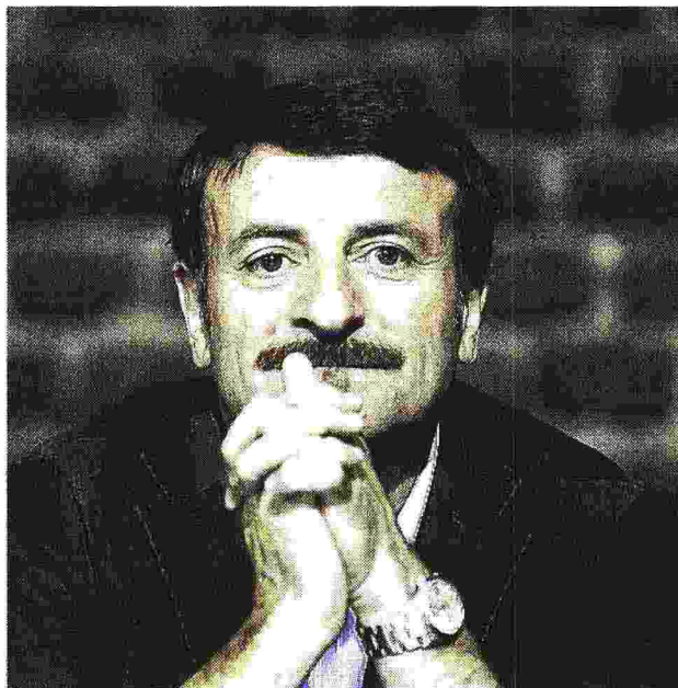
Giacomo Poretti fa parte del famoso trio Aldo, Giovanni e Giacomo

«Chi è più fortunato deve dare una mano. Mi sembra naturale»